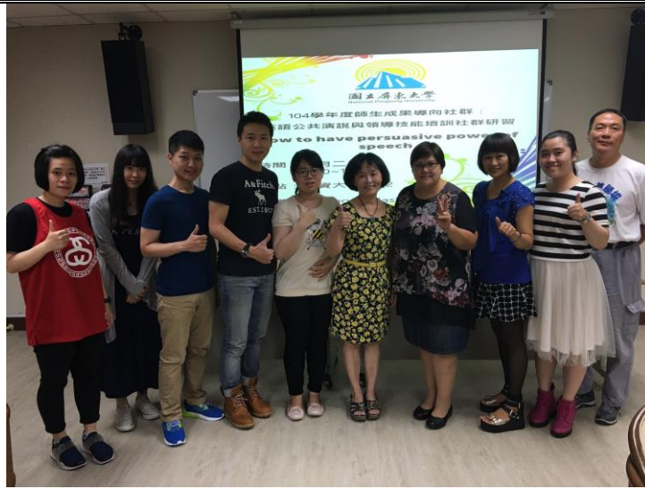
《6/2 英語公共演說與領導技能培訓社群成員大合照》