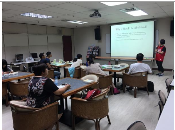
6/2 英語公共演說與領導技能 培訓社群成員演說練習