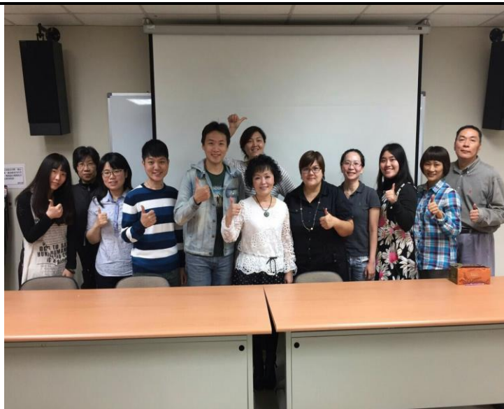
《3/27 英語公共演說與領導技能培訓社群成員大合照》