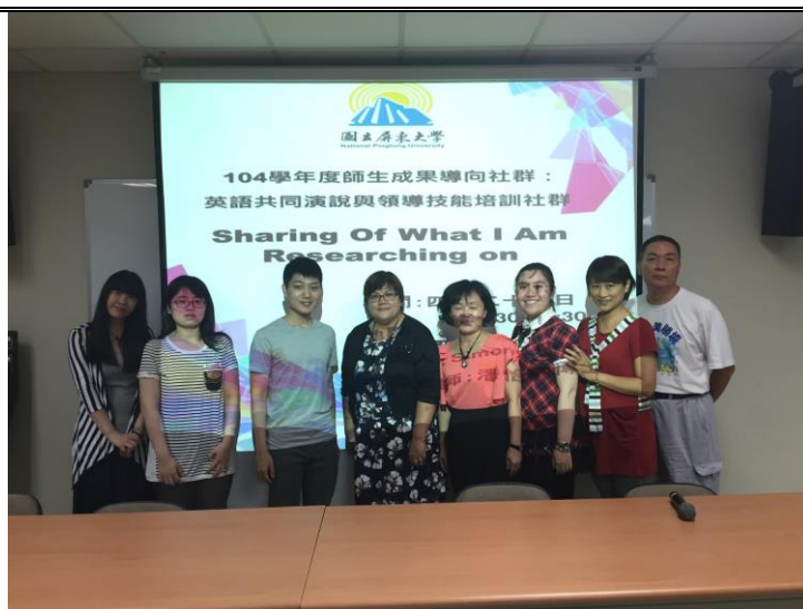
《4/28 英語公共演說與領導技能培訓社群成員大合照》