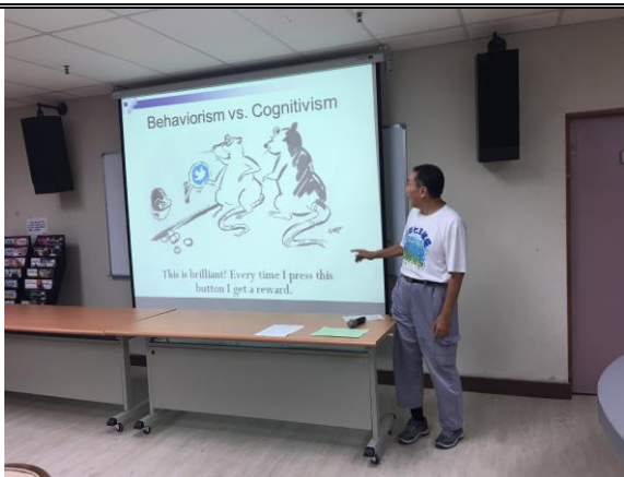
6/2 英語公共演說與領導技能 培訓社群成員演說練習